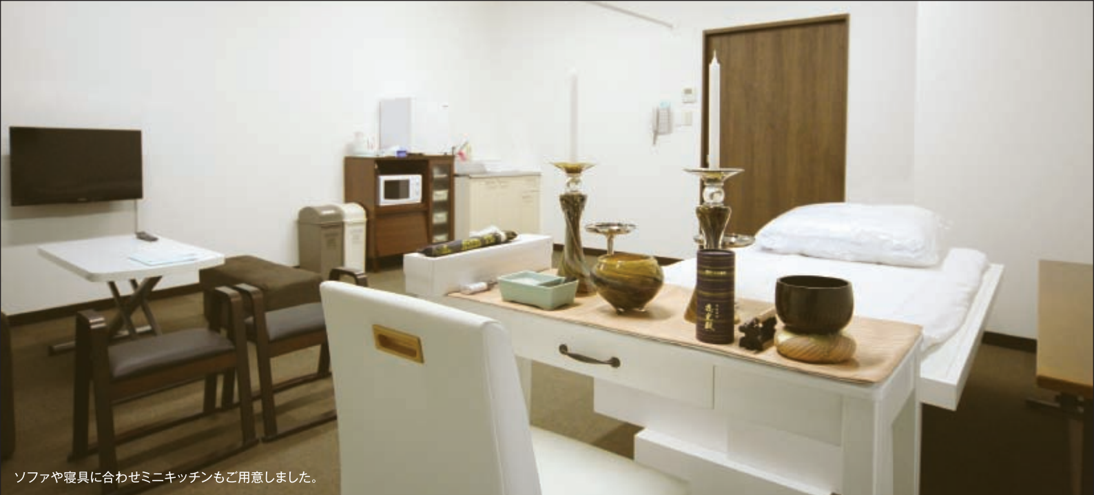
ソファや寝具に合わせミニキッチンもご用意しました。